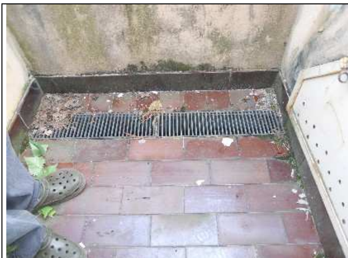
Foto nr. 7: Dettaglio dei balconcini da rifare con inserimento di sfioratori