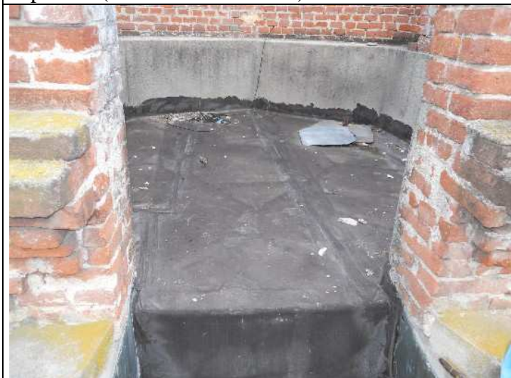
Foto nr. 11: Dettaglio dell'impermeabilizzazione dei terrazzi delle torri da rifare