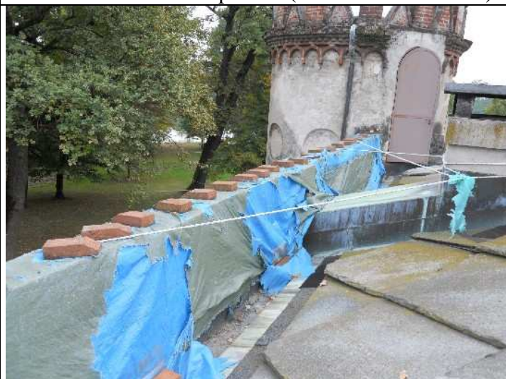
Foto nr. 10: Dettaglio dei parapetti murari della falda di copertura (rifacimento intonaco)