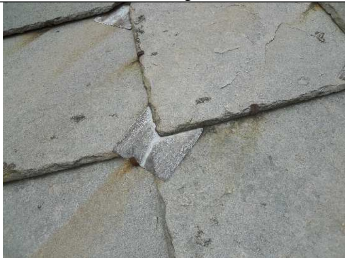
Foto nr. 6 : Particolare degli elementi in piombo esistenti tra le lose che sono da integrare con altri simili.