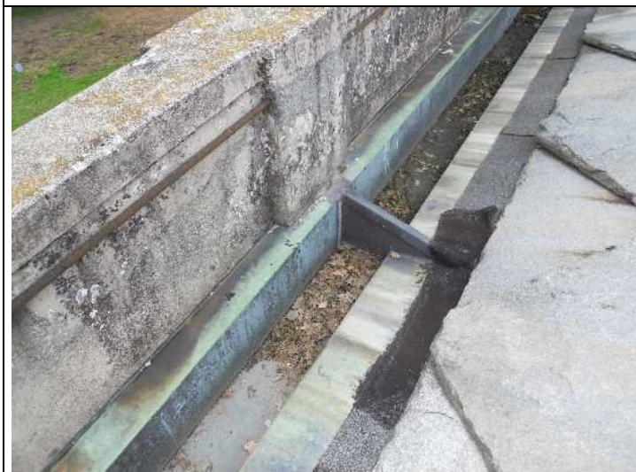
Foto nr. 9: Dettaglio dei parapetti murari della falda di copertura (rifacimento intonaco)