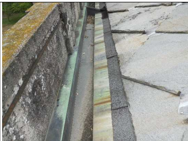
Foto nr. 8: Particolare della faldaleria dei parapetti murari della falda di copertura (rifacimento intonaco)